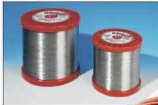
WeloEcoX Zink beschichteter Draht Zinc coated Wire Fil zingué

The most expensive and important tool for your erosion machine is the wire electrode. WELO offers a wide range of high grade erosion wires available. The economically-priced erosion wires from WELO are reliable with threading and you achieve a troublefree production. Our assortment contains blank and coated erosion wires as well as fine wires. WELO offers you the best cost-to-performance ratio and with that you will reach the best cut.