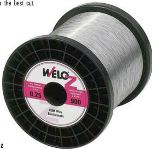
WeloZ Zink beschichteter Draht Zinc coated Wire Fil zingué

Bitte fragen Sie uns an. Please ask us for a quotation.