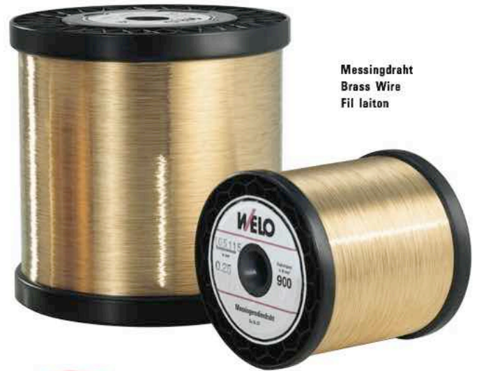
Messingdraht Brass Wire Fil laiton