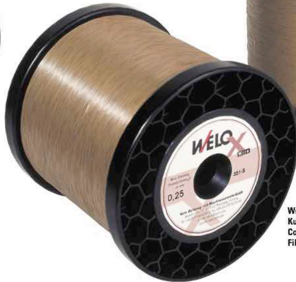
WeloX Kupfer-Zink beschichteter Draht Copper-zinc coated wire Fil revêtu cuivre/zinc